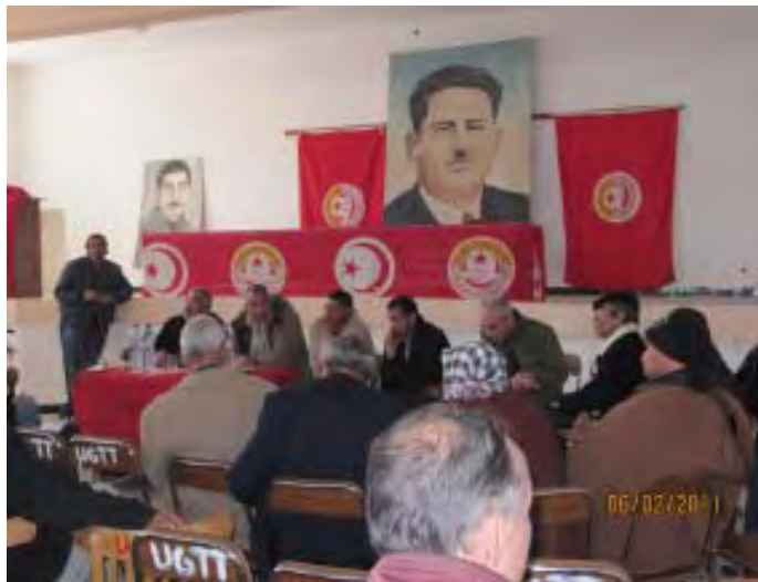
Reunió de coordinació dels Comitès de Defensa de la Revolució en els locals de la UGTT

La màxima de la revolució permanent estableix que, en aquest període històric imperialista, no són realitzables els objectius d'una revolució democràtica si no és la classe obrera qui dirigeix aquest procés i si no entronca directament amb els objectius de