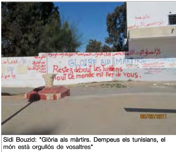
Sidi Bouzid: "Glòria als màrtirs. Dempeus els tunisians, el món està orgullós de vosaltres"

revolució. El moviment revolucionari es debat entre acceptar el 2n Govern Ghanouchi i vigilar-lo perquè apliqui el seu compromís cap a una Assemblea Constituent o combatre'l, en tant que no representa la ruptura amb el vell règim sinó que aquest tuteli una reforma. Així mateix el moviment concentra tot el seu odi en l'RCD, del qual exigeix la dissolució.