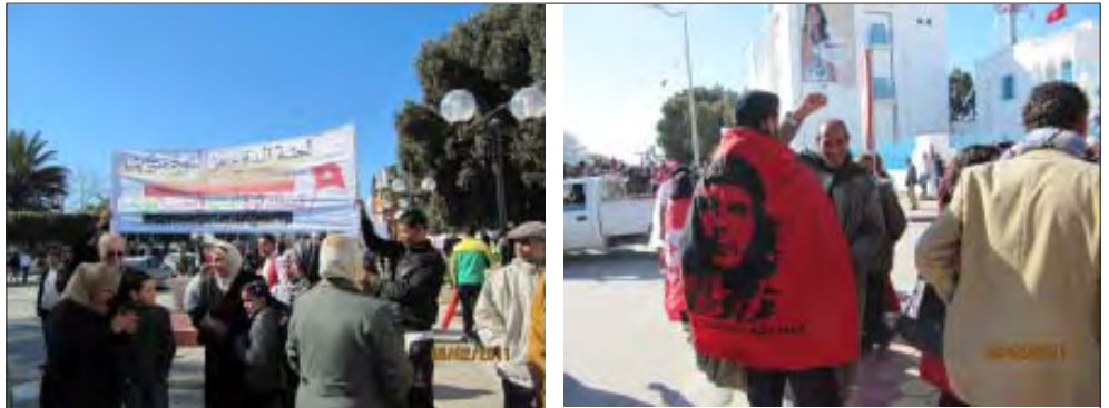
A la Caravana per la llibertat. A l'esquerra una pancarta de solidaritat amb Egipte

Els companys ens deien, i hi estem d'acord, que la revolució fins ara només ha aconseguit el 50%.