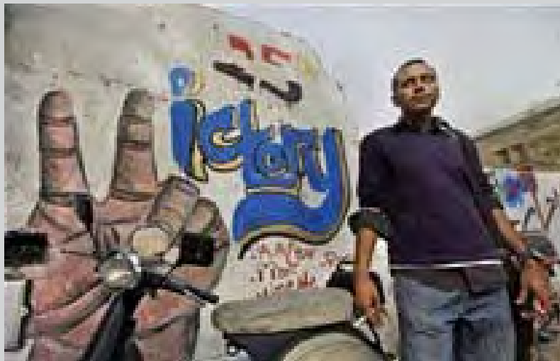
Legalització del primer partit islamista moderat encapçalat per Abu al-Ila Madi, a Egipte el passat 20 de febrer

Per això no hi ha res d'estrany en les declaracions dels Germans Musulmans egipcis o de Rachid Ghanuchi, el líder islamista tunisenc, que es comprometen a treballar cap a una «democràcia parlamentària» en base al model turc, és a dir, cap a un règim burgès pro imperialista. Davant del devessall de mobilitzacions de les masses contra els règims bonapartistes al món àrab, els islamistes es converteixen en agents de l'imperialisme per salvaguardar el sistema capitalista en aquests països, intentant «robar democràticament» les revolucions populars. És un fet que també ha de contribuir a corregir les posicions d'alguns sectors de l'esquerra revolucionària que atribuïen «antiimperialisme» als islamistes. Felicitment ja no aixequen consignes com «tot el poder als Germans Musulmans», tal com ho van fer al Líban («tot el poder a Hezbolà»), perquè ja es veu clarament que tant els Germans com els seus semblants (Hezbolà, Hamas, etc.) no són res més que partits burgesos independentment de si tenen o no armes a les mans.