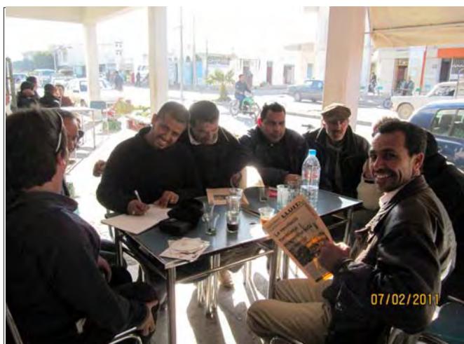
Comitè de Defensa de la Revolució de Regueb

El motor de la revolució van ser els joves desocupats/des i de secundària. Però en els moments més determinants el moviment obrer va entrar en acció amb vagues generals. Ara molts treballadors/es treuen a la llum les seves reivindicacions, soterrades durant anys, d'ocupació, feina fixa