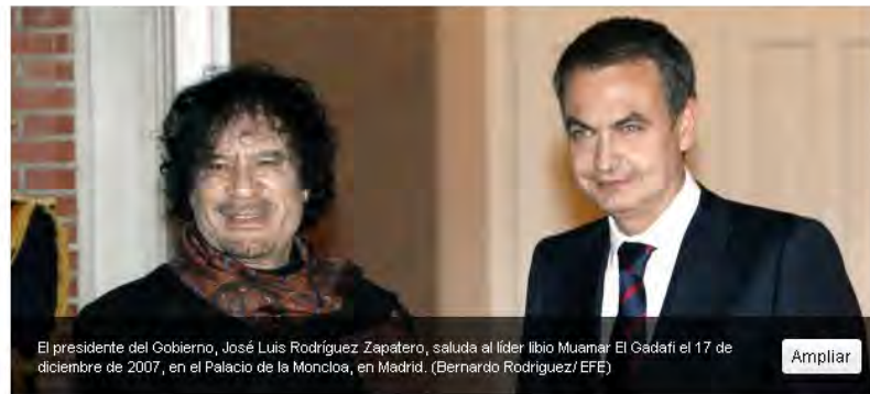
El presidente del Gobierno, José Luis Rodríguez Zapatero, saluda al líder libio Muammar El Gaddafi el 17 de diciembre de 2007, en el Palacio de la Moncloa, en Madrid.