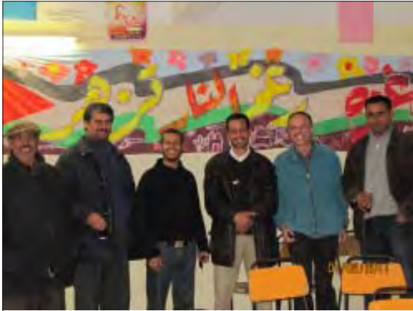
Mural fet per una escola de Regueb en solidaritat amb Gaza

convençuts/des que ara seria més fàcil la inversió estrangera. Nosaltres manifestàvem els nostres dubtes. A Regueb no hi ha ni una sola fàbrica ni empreses, és un poble agrícola, les infraestructures no existeixen, ni carreteres ni hospitals. Allà es produeix el 13% de l'agricultura de Tunísia.