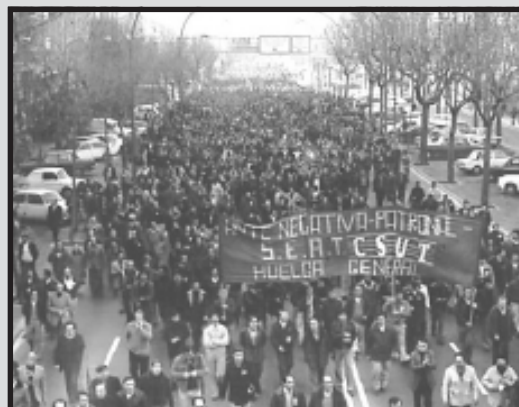
Manifestació de la SEAT- Barcelona

Així mateix, a més de les vagues locals i generals, en aquest període eren bastant freqüents les jornades de lluita, en les quals es feien coincidir les vagues pels convenis col·lectius més importants (metall, construcció, hostaleria...) amb els de les grans empreses, tant a nivell local, com provincial o estatal, i en aquest marc se celebraven manifestacions massives que confluïen al centre de les ciutats. D'altra banda moltes de les empreses que presentaven expedients de crisi eren ocupades pels i les treballadores, que hi establien sistemes de control i defensa per evitar els tancaments i la desaparició de les màquines.