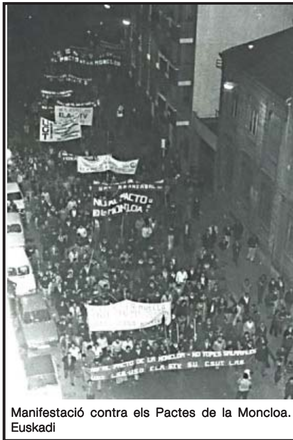
Manifestació contra els Pactes de la Moncloa. Euskadi

I el més important s'exigeix la pau social i el cessament de la lluita obrera. Signen d'una banda el president del Govern, Adolfo Suárez, i de l'altra els dirigents del PSOE, del PCE i la resta de partits parlamentaris. Els acords van ser ratificats posteriorment al Congrés i el Senat. CCOO i UGT, els dos grans sindicats controlats pel PSOE i el PCE, callen i acaten. Comencen a imposar reculades i traïcions a les lluites, debiliten la capacitat de resposta dels treballadors/es. És el preu que havien de pagar per estabilitzar la Monarquia. Però aquesta tasca no seria fàcil i la classe obrera es resistiria a ajupir el