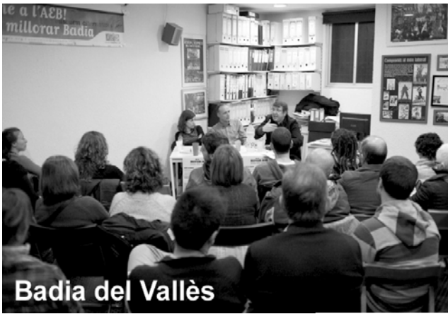
Badia del Vallès