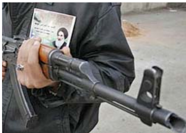
Policia iraquiana amb una imatge de l'Aiatolà al-Sistani

El fill de Baqer, Abdul Aziz al-Hakim, va assumir el lideratge del partit i va imposar una línia més pragmàtica, que el va dur a participar el 2003 al Consell del Govern Interí amb dos ministres, i el 2004 al govern interí d'Ijad Allaui, amb dos ministres més. El CSRII sempre va reclamar la seva proximitat al gran aiatolà Sistani, perquè hi comparteix la mateixa base de poder (classe mitjana, predominantment mercantil) que dóna forma a les seves perspectives polítiques i contrasta amb, per exemple, les arrels més «humils» dels saderistes. D'altra banda la Hawza (seminari religiós) i la seva història li proporcionen una certa afinitat. A les eleccions de 2005 el CSRII va pujar al poder. A nivell provincial, a causa del suposat suport de Sistani, i també al boicot dels àrabs sunnites (especialment a les zones on són majoritaris) i el moviment d'al-Sader (a les governacions del Sud). A nivell nacional, juntament amb altres partits xiïtes, va formar la Coalició Unificada Iraquiana que va guanyar 140 dels 275 escons del Consell de Representants (parlament). En aquesta època el CSRII es va llançar a la lluita contra els seus opositors xiïtes, sobretot els saderistes, i contra la resistència sunnita antiocupació. Les Brigades de Bader van ser acusades de