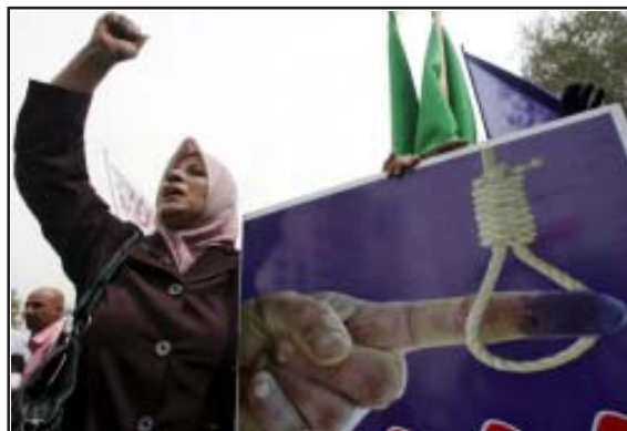
Seguidora d'al-Maliki en les eleccions de març

La novetat al Kurdistan és l'aparició del partit Gorran (Canvi) que va trencar la unitat kurda i va obtenir un 4,42% dels vots, amb 8 diputats, davant de l'Aliança Nacional Iraquiiana, formada pel partit Democràtic del Kurdistan, de Barzani, i la Unió Patriòtica del Kurdistan, de Talabani (15,7% i 43