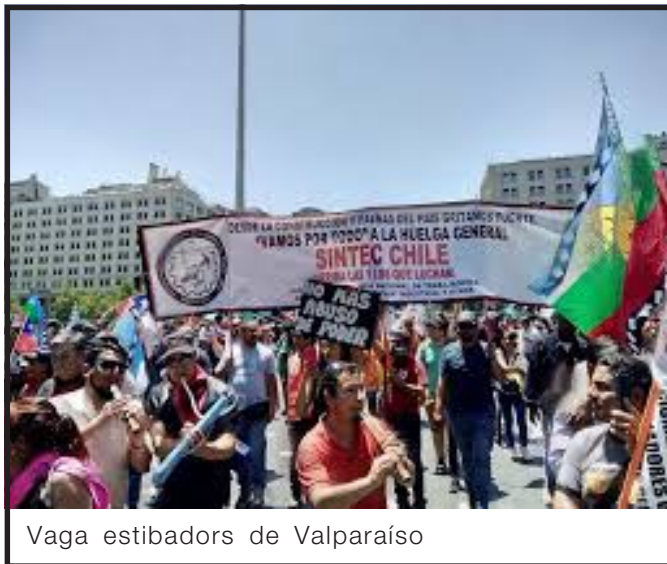
Vaga estibadors de Valparaíso

Fins i tot la patronal pot reemplaçar als vaguistes legalment, de manera que ridiculitza el poder de la vaga. Molta d'aquesta legislació segueix vigent.