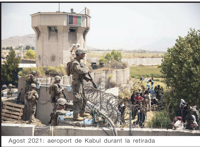
Agost 2021: aeroport de Kabul durant la retirada

afganeses, quan durant anys els han maltractat descaradament. Hem vist com les seves criatures morien ofegades a l'Egeu, les pallisses a mans dels policies a les fronteres de Sèrbia o com Alemanya, França, Holanda, Àustria, Itàlia o Grècia feien deportacions massives sense cap escrúpol a l'Afganistan, negant l'evidència d'una guerra en què ells mateixos participaven. Les situacions més brutals de discriminació i racisme les hem vist als camps de refugiats europeus amb els i les afganeses.