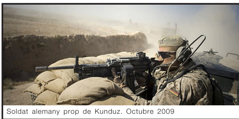
Soldat alemany prop de Kunduz. Octubre 2009

Però les raons del malestar continuen: les dictadures, el deteriorament de les condicions de vida, la falta de futur per als joves, la islamofòbia, o els greuges per la política d'occident creen el caldo de cultiu per a moviments fonamentalistes que prometen règims islàmics «purs» -el paradís a la terra- contra la discriminació els governs que actuen al dictat de l'imperialisme. I mentre persisteixin aquestes causes de fons i no es construeixin organitzacions capaces d'obrir una perspectiva internacional de classe, aquests moviments continuaran operant, amb sigles velles o noves.