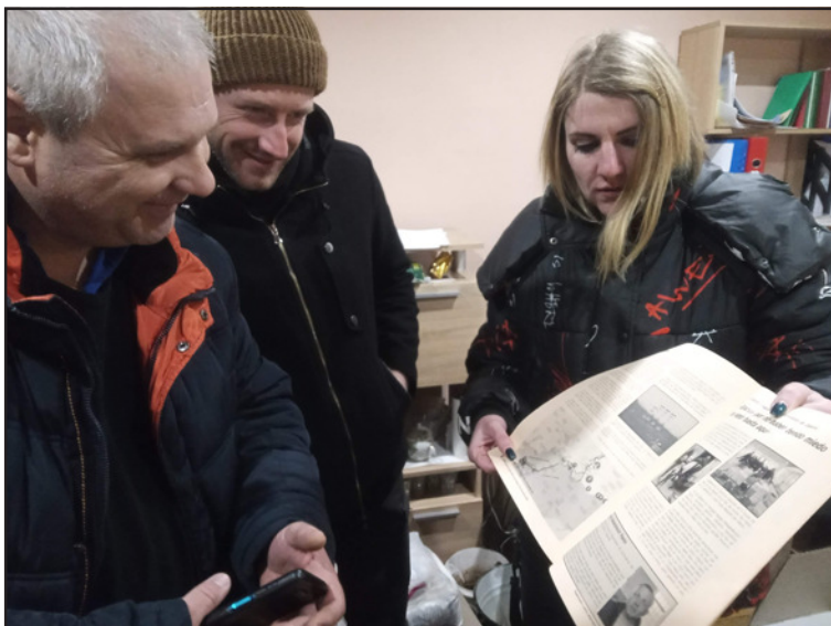
Reconeixent-se en el suplement del comboi anterior