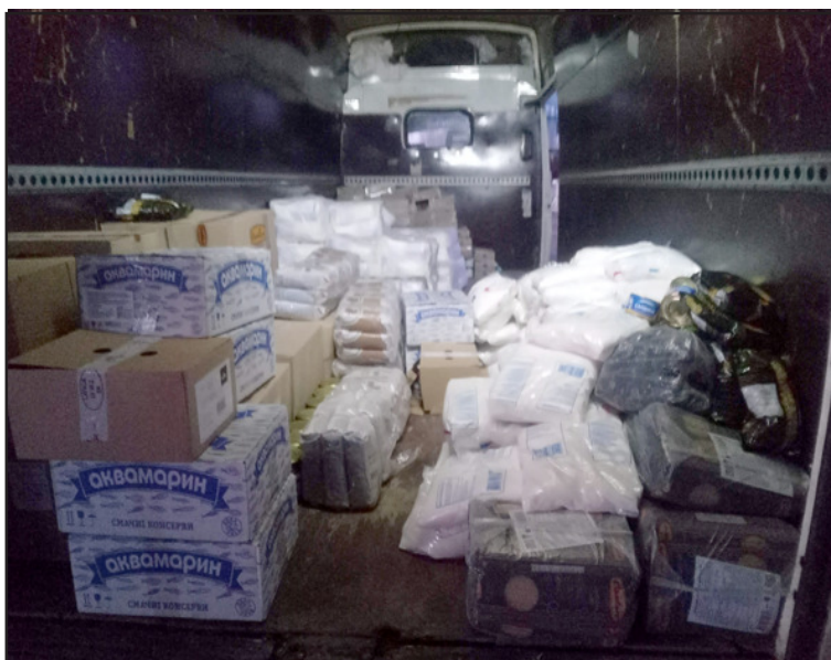
Compra a la furgoneta

Pots subscriure't a la nostra revista mensual (a escollir versió en castellà o en català) enviant les teves dades a l'apartat de correu i fent l'ingrés per un any al compte corrent: ES64 2100 3459 3821 0022 0515 (25 euros si te l'hem d'enviar per correu dins de l'Estat espanyol). La subscripció de lliurament en mà és de 17 euros i la podeu fer posant-vos en contacte amb qualsevol militant del grup.