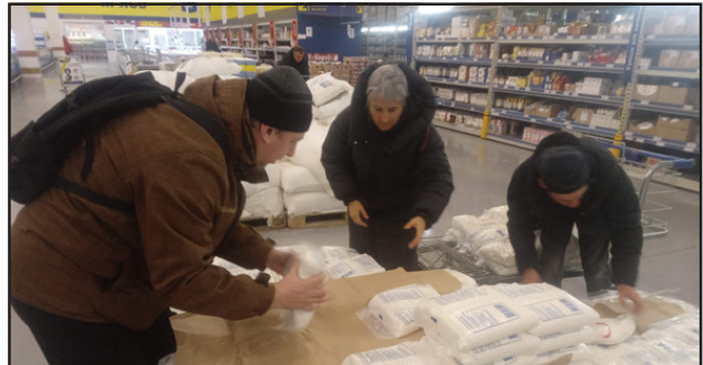
3er comboi -febrer 2023- menjar pel sindicat ferroviari de Zaporíjia i el miner de Dobropília, al Donbàs.

Altres sectors, des del pacifisme, es limiten a denunciar la carrera armamentística i l'increment de la despesa militar, com si fos per culpa del poble ucraïnès. No ens enganyen: els pressupostos militars inflats no són per ajudar el poble ucraïnès sinó per blindar els interessos de la burgesia a cada país. Reclamar un alto el foc i una negociació sense exigir la retirada de les tropes invasores és premiar l'agressió armada imperialista de Putin amb conquestes territorials.