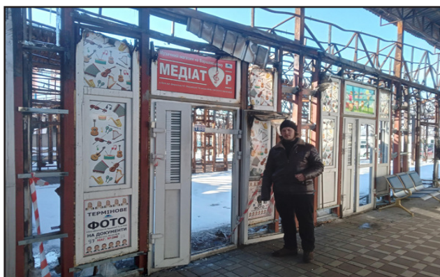
Butxa. Mercat bombardejat