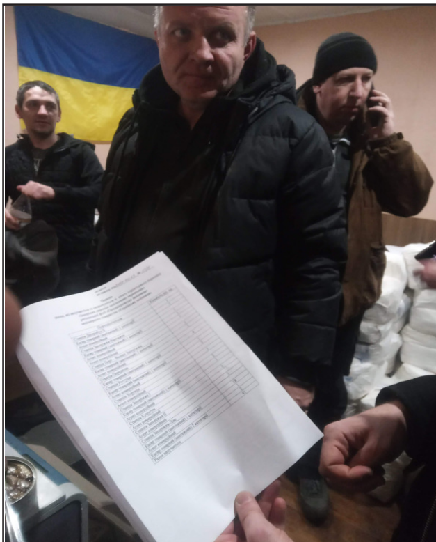
Distribució dels lots als treballadors ferroviaris