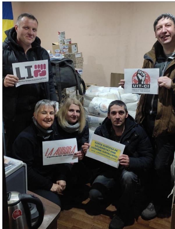
Zaporíjia. Reconeixement a les organitzacions que han col·laborat en el comboi organitzat per la UIT-QI