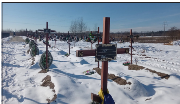
Tombes sense nom, víctimes de l'ocupació russa el març passat a Butxa