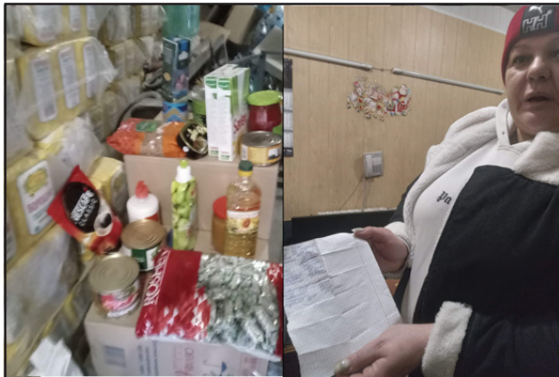
Dobropíllia (Donbàs). La nostra aportació i la llista de les famílies receptors.