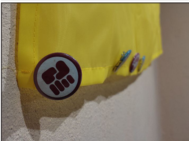
Local sindical ferroviari de Zaporíjia: emocionant veure les nostres xapes del comboi anterior en la bandera ucraïnesa!