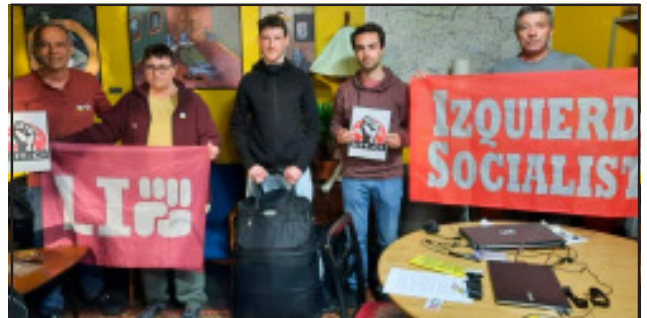
1er comboi -maig 2022-: kits de primers auxilis pels joves antiautoritaris de Col·lectiu Solidaritat a les Defenses Territorials

se al reclutament i fugint del país. Per això la solidaritat internacional amb les xarxes que donen suport als joves russos que escapen de la guerra és clau i cal exigir als governs de la UE que els garanteixin asil polític.