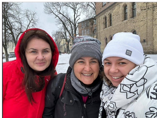
Kíiv. Amb les companyes del Sindicat de Mestres