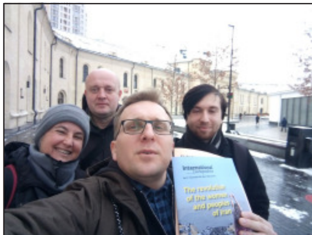
Kiiv. Amb els companys del Moviment Social