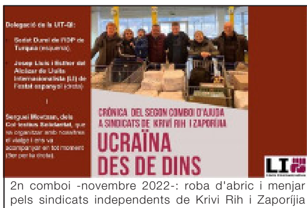
2n comboi -novembre 2022-: roba d'abric i menjar pels sindicats independents de Krivi Rih i Zaporíjia

Assistim a una escalada en la despesa militar, però no per ajudar Ucraïna, sinó per blindar els EUA i els països europeus. Si els imperialismes europeus i nord-americà lliuren armes al Govern de Zelenski no és perquè els preocupi el poble ucraïnès, sinó per satisfer els seus interessos. Les armes arriben a Ucraïna en comptagotes, amb l'objectiu