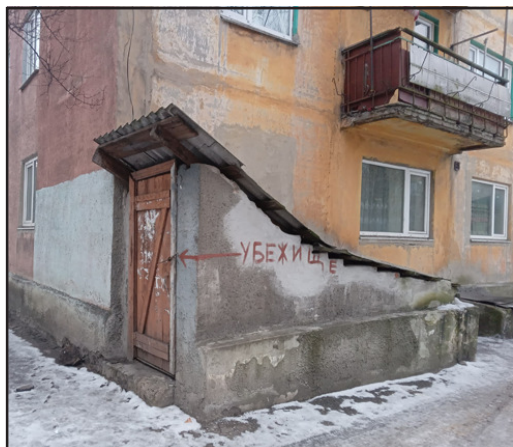
Refugi en vivenda

DZ- Durant el Maidan vaig entrar amb la meva dona a una botiga, on hi havia un llibre perquè la gent escrigués els seus desitjos per a Santa Claus. Vaig escriure «pau al món», com qui diu qualsevol cosa. Ara entenem com és d'important la pau.