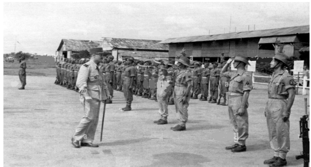
General Leclerc passant revista als gurkes de l'exèrcit britànic

El 5 d'octubre, van arribar els reforços francesos amb el general Leclerc, disposat a restaurar l'ordre i " construir una Indoxina forta dins de la Unió Francesa ". Els mesos següents, els francesos van recuperar el control del Vietnam amb el consentiment del Vệ t Minh . Al març de 1946, Hồ Chí Minh va signar un acord per rebre els