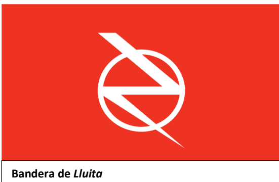
Bandera de Lluita

A finals de 1931 els dos grups es van fusionar al Ta doi lap (Oposició d'Esquerra) . Van mantenir Thang Muoi (Octubre) com a òrgan teòric i el Ta doi lap tung thu (Edicions de l'Oposició d'Esquerra) difonent clàssics marxistes en vietnamita. Va ser trencat per la repressió el 1932: la policia política va detectar les «impresmes». 65 militants i simpatitzants van ser detinguts, una trentena a Saigon 6 . El moviment de masses estava en un fort reflux, gairebé anihilat per la reacció francesa.