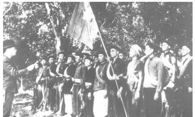
"Guàrdia republicana" del Vjêt Minh a Saigon