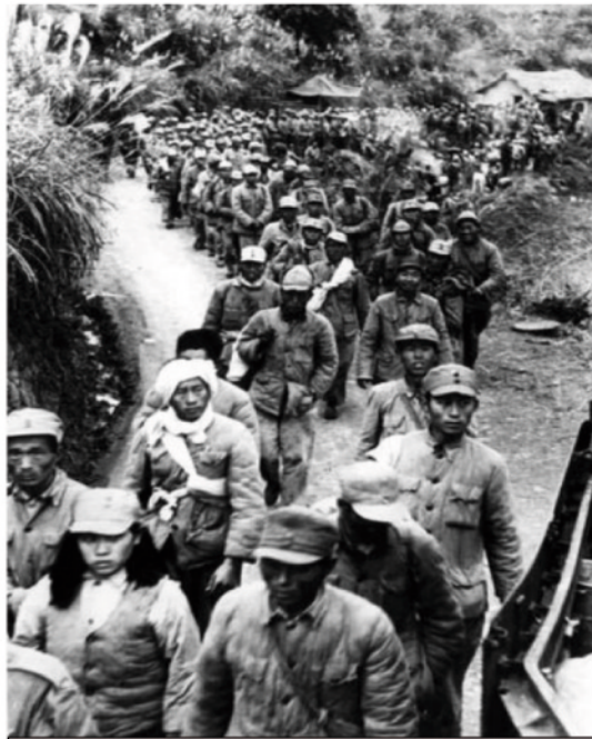
Detencions massives franceses