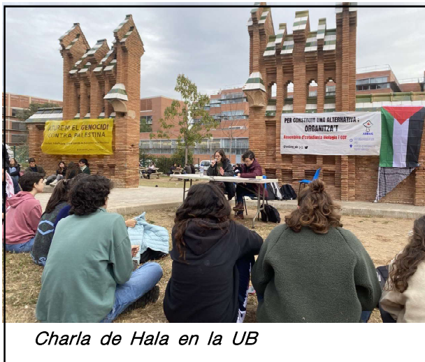
Charla de Hala en la UB

Y luego está toda la cuestión de la coordinación de la seguridad con Israel: básicamente este «Estado» que tenemos es un agente del colonizador israelí que deambula por las calles de Cisjordania atacando a la gente, arrestando gente y haciendo el trabajo de Israel. Así que, básicamente, sólo ha hecho a Israel más fuerte y a los palestinos más débiles, tanto económica como políticamente. La expansión de los asentamientos en Cisjordania se disparó después de que se estableció este «Estado palestino» porque allí hay un organismo como la Autoridad Palestina que aplasta cualquier forma de resistencia.