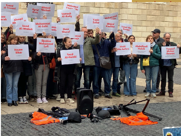
Periodistas. Barcelona 9/11/23