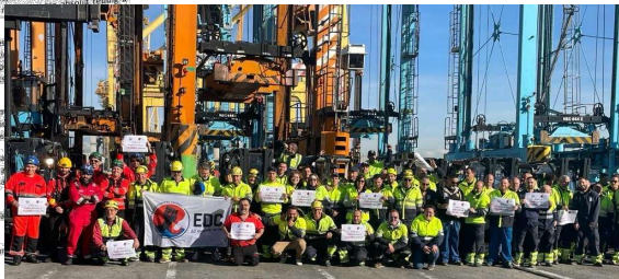
Barcelona, a 6 de novembre de 2023.

Denuncias de instituciones que mantienen relaciones o reciben materiales israelíes, y exigencia de la ruptura de relaciones, como en la Facultad de Físicas de la UB.