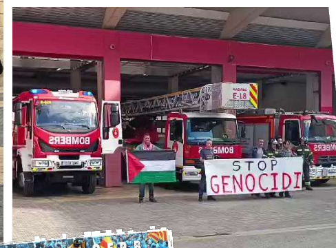
Bomberos 17/11/2023 Estibadores. 30/11/2023

SOLIDARITAT AMB ELS EQUIPS D'EMERGÈNCIA I LA POBLACIÓ CIVIL DE PALESTINA