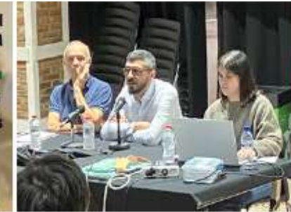
Charlas y comités