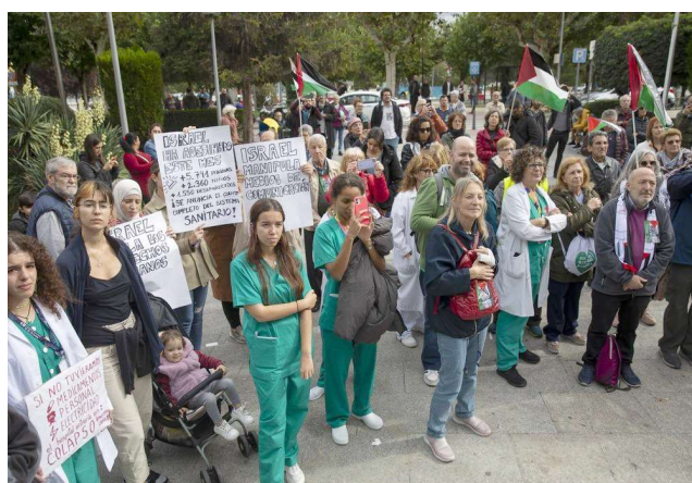
Madrid, Hospital 12 de Octubre, 26/10/23. Barcelona, CAP P. Claret. 17/11/23

I la resposta dels i les treballadores sanitàries, a nivell estatal -el mateix es va reproduir a la Generalitat-, exigint al Ministeri de Sanitat i al Govern espanyol: -Fi del setge i bombardejos -Entrada ajuda humanitària -Fi de la cooperació militar i comerç amb Israel