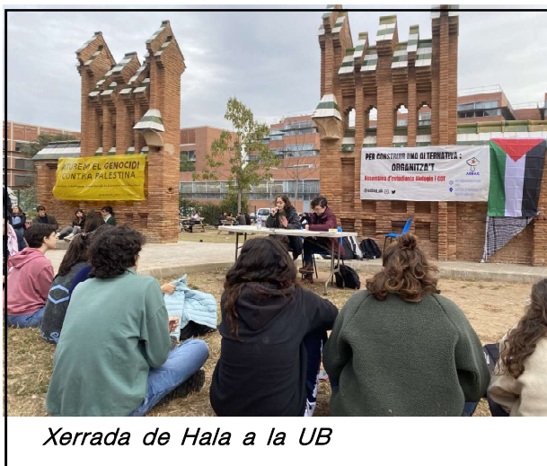
Xerrada de Hala a la UB

I hem d'anar més enllà dels marcs del dret internacional. Necessitem deixar d'esperar que els palestins adaptin les seves experiències i dolor a aquests marcs. Deixem d'esperar que els palestins diguin el que volen sentir les «oïdes blanques». La solidaritat no pot ser condicional. No hem de ser part d'aquesta lluita perquè sentim pena pels palestins, perquè ara aquesta lluita ens concerneix a tots. I, finalment, crec que cal donar suport a la resistència palestina en totes les formes. No només es pot ser solidari amb els palestins si moren, també cal ser solidari quan estan lluitant.