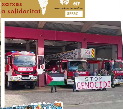
Bombers 17/11/2023 Estibadors. 30/11/2023