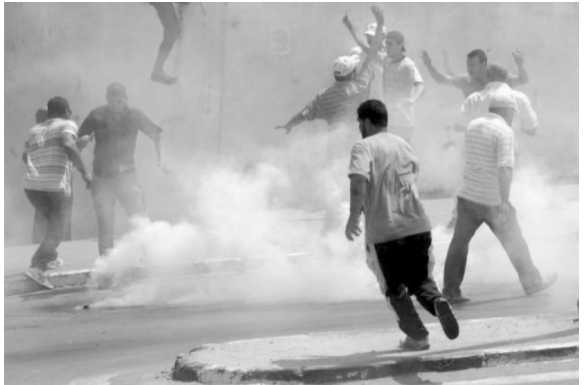
Manifestació a Tunis el 13/08/11 exigint justícia

Les eleccions a La Constituent van ser convocades pel juliol i ajornades fins el 23 d'octubre. Hi ha tot un sector encapçalat pel govern i els partits reformistes que plantegen que tota sortida als problemes del poble tunisià es resol amb les eleccions. Un altre sector, encapçalat pel PCOT i els CDR de l'interior, plantegen que l'etapa actual de la revolució és només democràtica i que cal participar-hi en les millors condicions perquè el poble pugui votar. Uns i altres centren tot l'esforç en les eleccions i participen en el Comitè per a les Eleccions creat per l'Alta Instància. Aquest Comitè té com a objectiu elaborar, mitjançant inscripció, el cens electoral. Tots els partits d'esquerra, la UGTT i els millors activistes dels CDR, estan ficats en aquesta tasca, amb el centre de la