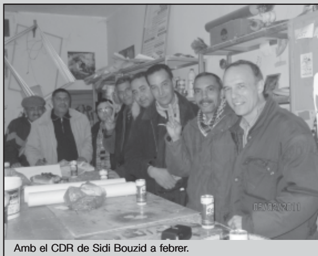
Amb el CDR de Sidi Bouzid a febrer.

Un altre aspecte que també vam analitzar amb ells va ser el paper de l'exèrcit. Aquest emergeix com a àrbitre després de la caiguda de Ben Ali: no havia reprimit i en alguns casos havia impedit que s'assassinessin treballadors/es. Però per nosaltres això no volia dir que l'exèrcit fos revolucionari: volia dir que deixava de recolzar la dictadura perquè estava derrotada, no pas perquè estigués amb el poble. Al contrari, és la institució clau i el pilar del capitalisme a Tunísia. No hi ha ruptura amb l'anterior règim si no es trenca amb l'exèrcit. Però els CDR van dipositar-hi la confiança. Un exemple: a Sidi Bouzid, dos companys són assaltats a la carretera i el primer que fan és posar-se en contacte amb l'exèrcit per salvar la situació. Creiem que aquesta confiança en l'exèrcit és un dels aspectes més negatius dels CDR.