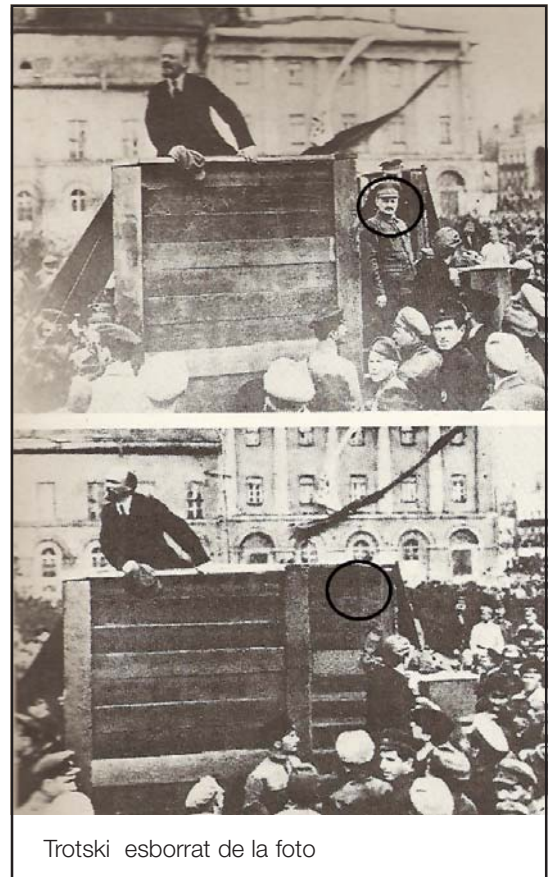
Trotski esborrat de la foto

Trotski, a la seva biografia d’Stalin, respon a la pregunta, inevitable, amb les següents paraules: “La lluita pel poder de l’Oposició d’Esquerra, d’una organització marxista revolucionària, només era concebible sota les condicions d’un ascens revolucionari. En aquelles