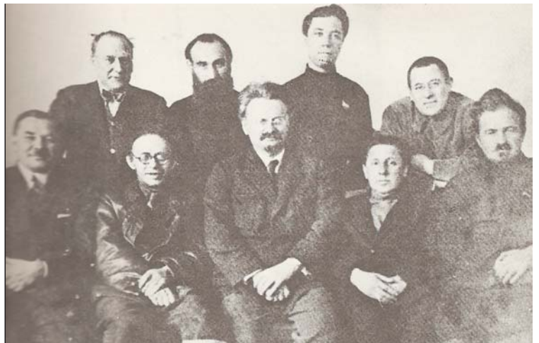
Membres de l'Oposició d'Esquerra camí de l'exili

Els i les deportades tenien una intensa vida política. S'esforçaven a discutir tots els textos que havien d'expressar una posició col·lectiva, i després els feien circular. P. Broué afirma que "difícilment en la història del marxisme hi ha hagut un període més fecund i més creatiu, i uns resultats menys coneguts o directament desconeguts", i cita, tot seguit, uns quants textos d'aquesta època: "Els perills professionals del poder" i "Les lleis de la Dictadura Socialista", de K.