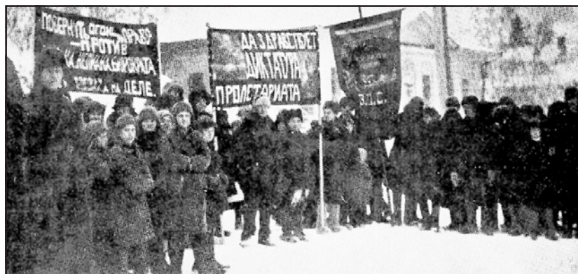
Manifestació de deportats a Yenisei, el 7 de novembre de 1928. Les banderes diuen: "El foc contra la dreta, contra el kulak, l'home de la NEP i el buròcrata!", "Visca la dictadura del proletariat!".

La burgesia imperialista intenta convèncer-nos cada dia que el món actual és el millor dels mons possibles i que ella és l'única força social capaç de conduir la història i guiar la humanitat. Els seus historiadors/es i opinòlegs/ues desautoritzen tota anàlisi diferent de la seva interpretació, imposant les aparences i alguns fets de la superfície a la complexitat del desenvolupament històric. Així, amb la història reduïda a una interpretació feta a mida, la burgesia ens presenta qualsevol intent de la classe obrera per dirigir la societat com a inevitablement condemnat a la derrota i el desastre. La degeneració de l'Estat soviètic durant els anys 20 i 30, i el seu efecte sobre el moviment obrer mundial al segle XX, així com el procés de restauració capitalista als abans anomenats "països socialistes", són els "fets" en què