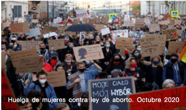
Huelga de mujeres contra ley de aborto. Octubre 2020

trariamente a la segunda, no genera ni grandes, ni siquiera pequeñas protestas de masas. Sobre este plano, visiblemente, los marxistas revolucionarios tenemos que ser pacientes.